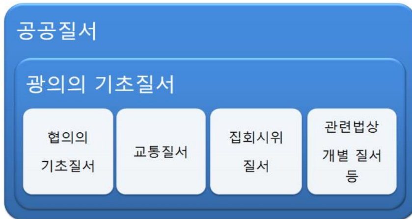
<그림 2-1> 기초질서의 개념과 범위

정리해보면 기초질서의 개념과 범위는 공공질서 > 광의의 기초질서 > 협의의 기초질서와 교통질서, 집회시위질서, 기타 관련법상 개별질서의 순으로 상위 개념에 포함되는 것으로 볼 수 있으며, 이를 종합하여 도식화 하면 다음과 같다.