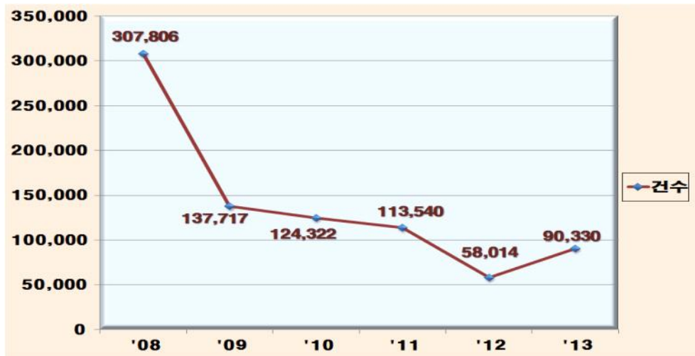
<그림 3-1> 2008년~2013년 전체 경범죄처벌법 단속 건수

이와 같은 경향은 아래의 그림에서와 같이 2008년부터 2013년의 현황을 보면 2008년은 2013년에 비해 거의 3배의 단속 건수를 보이고 있다는 결과에서도 찾을 수 있다.