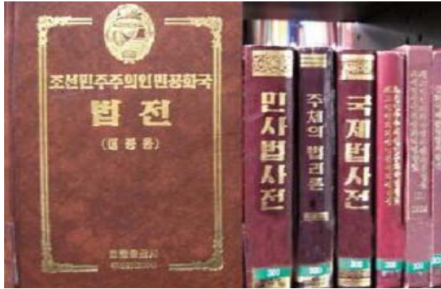
&lt;그림 1-2&gt; 북한의 법전과 해설서

에 다른 자료들을 충분히 입수할 수 없는 현실적인 한계로 인하여 내용 중 일부는 객관적인 근거가 빈약하고 단순한 추론에 거치는 경우도 있고, 북한 원전에 충실하려는 의도에서 다소 생소하거나 어색한 어구들이 내포되어 있음을 밝힌다. 예를 들어 남한의 형사절차에서 ‘혐의자(피내사자)⇒피의자⇒피고인’이 북한에서는 ‘혐의자⇒피심자⇒피소자’ 51) 사용되고 있는데, 이러한 북한의 용어들을 그대로 사용하고 있다는 것이다.