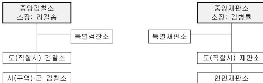
<표 3-7> 북한의 사법기관

북한헌법에는 검찰기관의 구성, 임무 및 내부관계 등에 대한 사항을 명문화하고 있는데, 과거 사회주의헌법에서는 재판소를 검찰소 앞에 규정하였으나, 1998년 개정헌법을 통해 검찰소를 재판소보다 앞서 나열하여 검찰소의 중요성을 부각시키고 있다. 사회주의 헌법은 검찰소의 구성, 임무 및 내부관계 등에 대한 사항을 명문화하고 있다. 헌법에 검찰과 관련한 규정을 명시하고 있는 것은 사회주의국가에서 검찰기관이 갖는 특수성 때문이다. 북한의 검찰은 사회주의적 준법성 확립을 위한 사법감시와 더불어 체제수호를 담당하는 통치기구의 중요한 축이 되고 있다. 18)