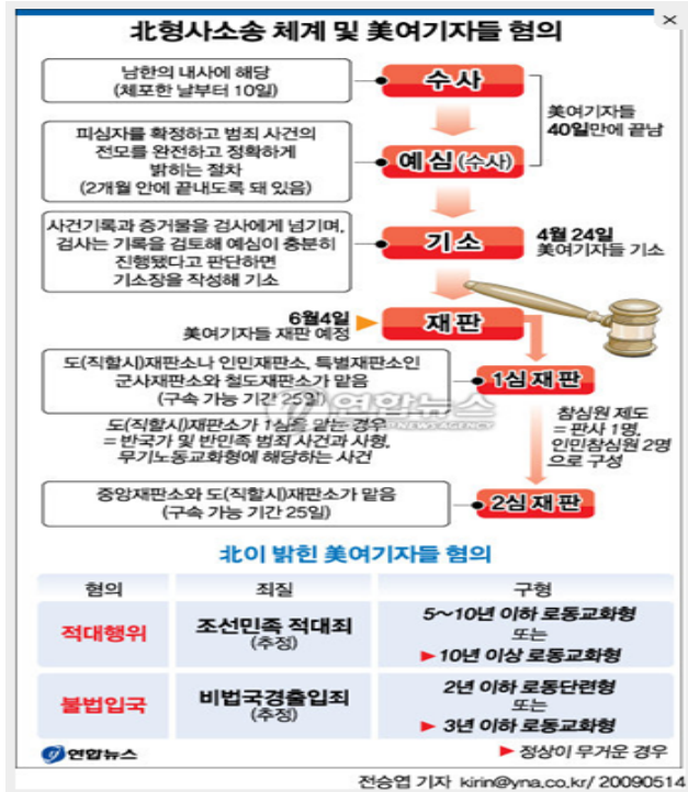
<그림 1-1> 북한 형사소송 체계 및 미국 여기자들의 혐의

이후 2008년 8월 말까 지 북한지역에서 모두 223건의 사고가 발생했는데, 이 중 산업재해가 179건(80%), 교통사고 32건(14.3%), 형사사건 11건(4.9%)의 순으로 나타났다. 20) 이러한 사건. 사고가 북한 체제와 사상의 특수성과 형사법에 대한 기초적인 지식을 가지지 못한 가운데, 북한 방문자나 체류자들이 사소한 잘못된 빌미를 제공하여 북한의 수사당