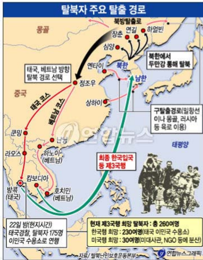
<그림 1> 탈북자 주요 탈출 경로 15)

의 실태조사에 따르면 응답자의 48.2%가 중국을 경유해서 한국으로 입국하였고, 53.1%가 2개국 이상의 나라를 거쳐 한국으로 입국한 것으로 나타났다. 16) 반면에 2007년 상반기 북한이탈주민(1,237명)의 국내 입국은 태국(39%)이 최대 경유국으로 부상하였고, 그 뒤를 이어 몽골(22%), 캄보디아(20%), 중국(16%) 순으로 나타났다. 17)