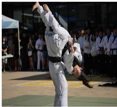
▲ 무도 시범단(합기도)