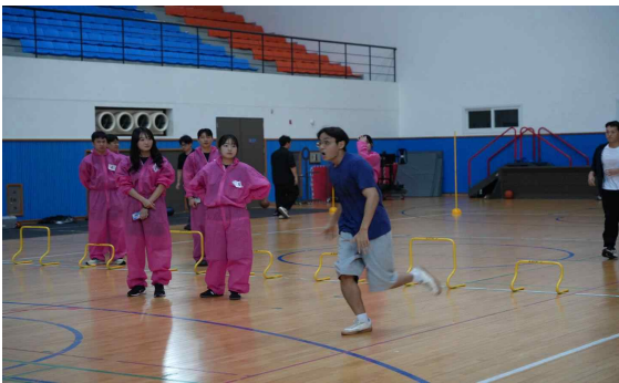
▲ ‘오징어 게임’ 프로그램