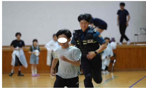
▲ ‘경찰과 도둑’ 프로그램