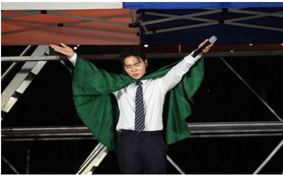
▲ ‘히든 싱어’ 프로그램

경찰대학 특유의 색깔을 보여주는 무도 시범을 선보였다. 유도, 검도, 태권도, 합기도 등 학생들이 수업 시간에 갈고닦은 기량이 무대 위에서 빛을 발했다. 단정한 도복 차림의 학생들이 날카로운 기합과 함께 기술을 선보일 때마다 관람석에서는 감탄과 박수가 이어졌다. 단순한 시범을 넘어, 꾸준한 훈련으로 다져진 학생들의 노력과 열정이 느껴지는 순간이었다.