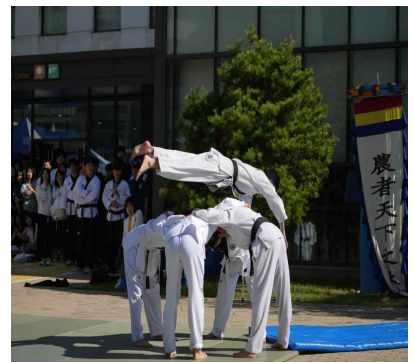
▲ 무도 시범단(태권도)