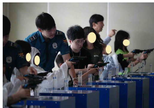
▲ 사회공헌 활동(시뮬레이션사격)